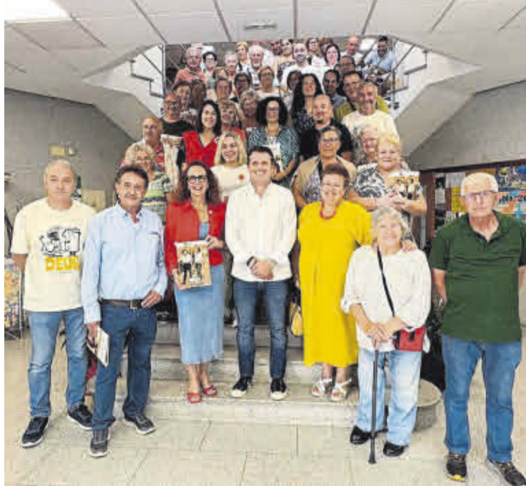
O alcalde, José Ramón Romero, no centro, na presentación da revista Folia de 2026.

O domingo 5, pola mañá, haberá alboradas con Ar de Loureda; baile con Abeloura, Ballet Folclórico Boirense e Abanqueiro; pasarúas da Banda