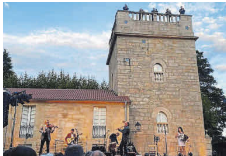
Imaxe de arquivo dunha actuación de Carlos Núñez fronte ao Pazo de Goiáns.

Quedarán despois por rehabilitar o lagar grande, as cocheiras, a vivenda dos criados e o pombal. ■