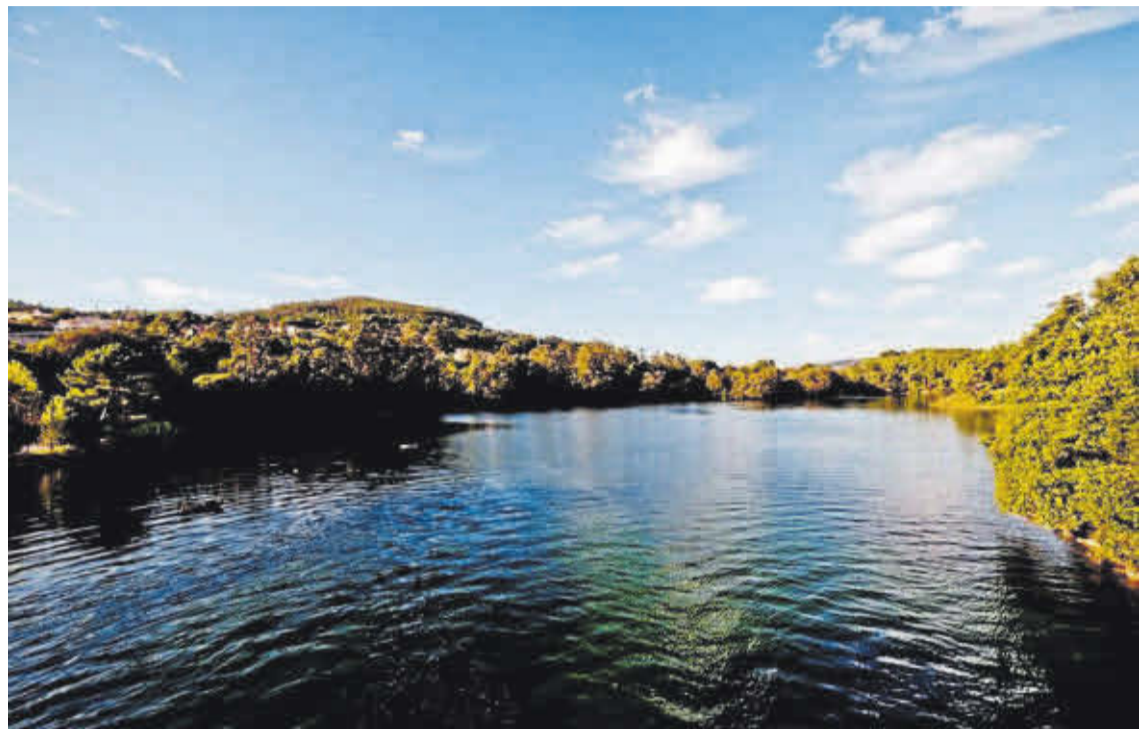
Espectacular panorámica do estuario do río Coroño, en Boiro.

Trátase dun espazo que se converte en períodos de baixamar en lugar ao que acoden gran cantidade de aves acuáticas atraídas polo abundante alimento que deixa ao descuberto a marea. ■