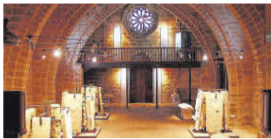
Interior da nave da igrexa de Santa María A Nova, onde se expón o conxunto de lápidas gremiais máis importante de Europa.

A pegada da peregrinación, unha das zonas históricas máis fermosas de Galicia e unha contorna privilexiada convértena nun destino único