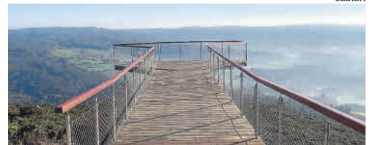
O miradoiro do Picoto ofrece unha panorámica única de Val do Dubra.