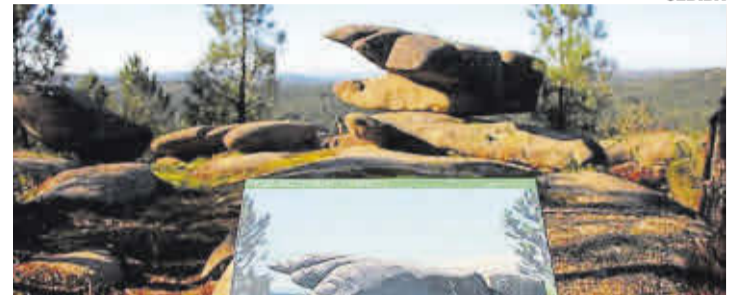
Os Penedos de Pasarela son un dos grandes atractivos turísticos de Vimianzo.