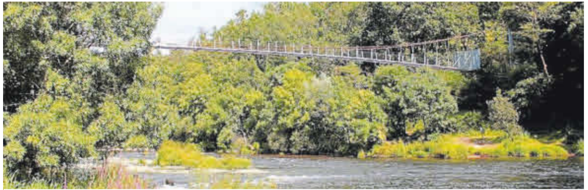
A ponte colgante do Xirimbao, construída en 1964, é unha das imaxes icónicas de Teo.

O Castro Lupario, Pontevea, o Xirimbao ou a Fraga de Sestelo son algúns dos seus tesouros