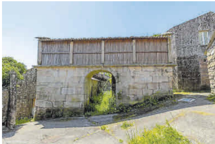
O Hórreo do Arco de Castro é unha das xoias patrimoniais de Dodro.

Nese percorrido destacan algunhas das xoias patrimoniais máis singulares do país, como o Hórreo do Arco de Castro, os conxuntos tradicionais de Imo, os pazos históricos de Lestrove, Hermida e Tarrío ou os numerosos cruceiros que salpican o territorio. O legado arqueolóxico tamén ten un papel destacado, con petróglifos da Idade