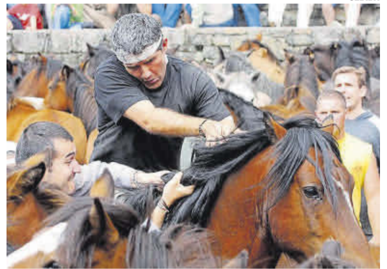
A Rapa das Bestas de Sabucedo é un dos emblemas da Estrada.

A Estrada é tamén terra de camiños e sendeiros. Polo seu territorio pasan tres rutas xacobeas e máis de 150 quilómetros de itinerarios sinalizados,