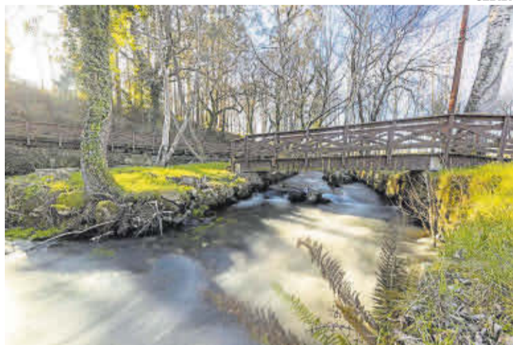
O paseo fluvial do Anllóns nace á entrada da área recreativa de Gabenlle.

A poucos quilómetros, en Golmar, o Centro de Interpretación dos Muíños de Auga da Costa da Morte permite descubrir a importancia histórica da cultura fluvial no municipio. Esa riqueza interior reflíctese tamén nas súas rutas de sendeirismo. O sendeiro do río Bradoso percorre un bosque de ribeira salpicado de antigos muíños; o do río Acheiro combina patrimonio etnográfico e paisaxe fluvial; e a ruta O sentir de Soandres une natureza, arqueoloxía e historia arredor do antigo mosteiro.