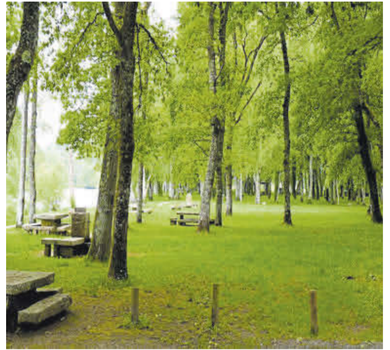
Outeiro de Rei posúe fermosas paraxes das que gozar en familia.

O concello é, ademais, unha boa opción para o turismo familiar. Marcelle Natureza permite achegarse a especies autóctonas e exóticas nun amplo espazo natural, mentres que Avifauna ofrece unha colección de máis de 300 especies de aves e desenvolve actividades de educación ambiental.