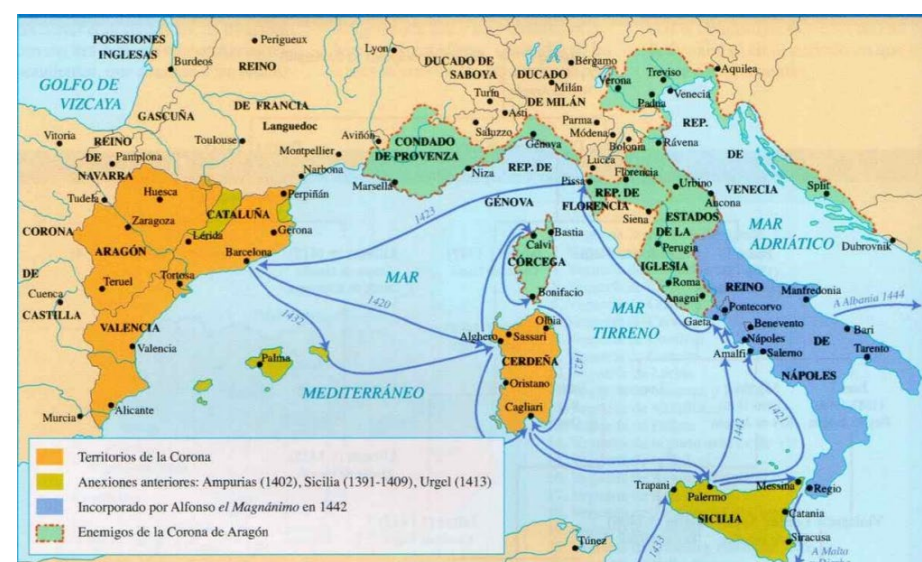
Territorios de la Corona de Aragón (naranja, azul y amarillo) a mediados del siglo XV.

Opción B. El mapa adjunto refleja la expansión de la Corona de Aragón por el Mediterráneo en la primera mitad del siglo XV. Contextualice esta expansión como resultado de las fases de creación y consolidación de la Corona aragonesa en la Península Ibérica en los siglos anteriores.