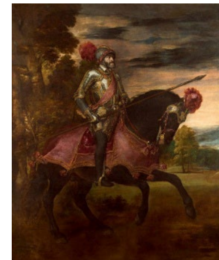
Carlos V en la batalla de Mühlberg (1547). Museo del Prado (Madrid). Tiziano (1548).

Opción A. Explique el papel de la religión en la política exterior de los Austrias Mayores , situando en su contexto histórico el cuadro adjunto.