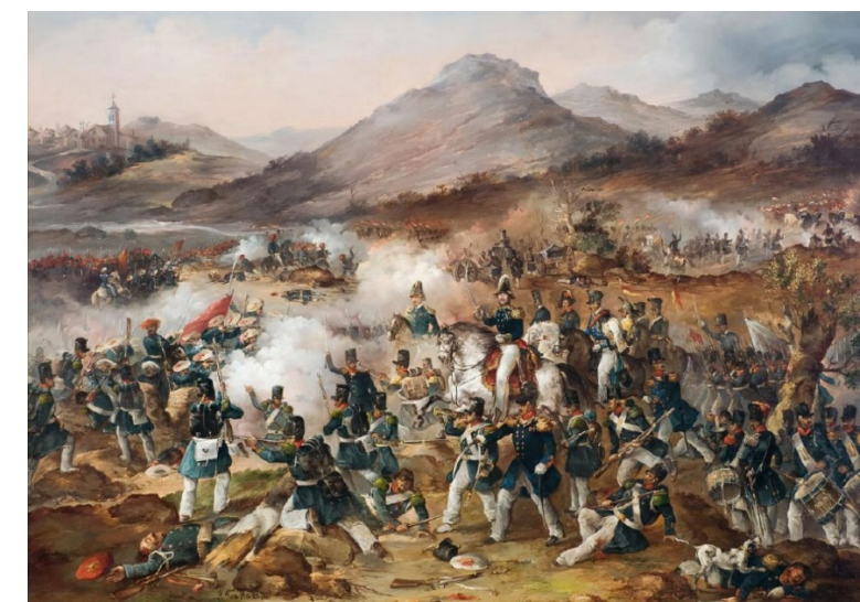
Batalla de Rmales (Cantabria, 1839). Museo del Carlismo. Francisco de Paula Van Halen (1841).

Opción A. En el cuadro se retrata muy probablemente la batalla de Rmales, en la que se enfrentaron las tropas carlistas y el ejército isabelino. Explique el desarrollo de la 1.ª Guerra Carlista y sus causas .