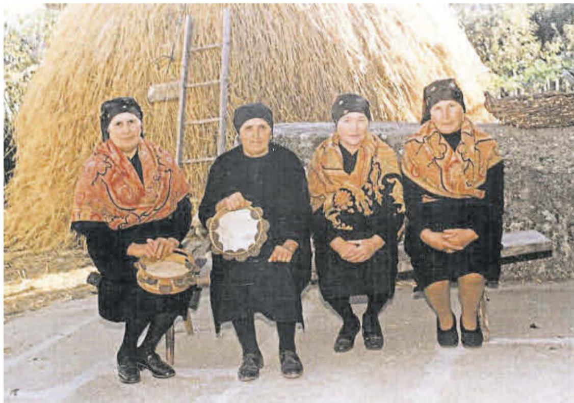
As cantareiras Teresa, Prudencia, Manuela e Adela en Mens.

A primeira persoa en ser recoñecida no Día das Letras Galegas foi Rosalía de Castro, a nosa autora máis universal. A RAG decidiu crear a celebración polo seu importante legado na literatura galega contemporánea, establecendo o 17 de maio como data para o festexo porque cadra coa publicación de Cantares Gallegos . A autora padronesa estacou polo seu labor fundamental no Rexurdimento, o movemento que recuperou o uso literario do galego no século XIX. Entre as súas obras máis importantes destacan tamén Follas Novas ou En las orillas del Sar .