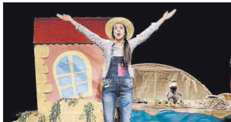
Un espectáculo anterior da Xanela do Maxín.

Trátase dun espectáculo que celebra o privilexio de Galicia de poder