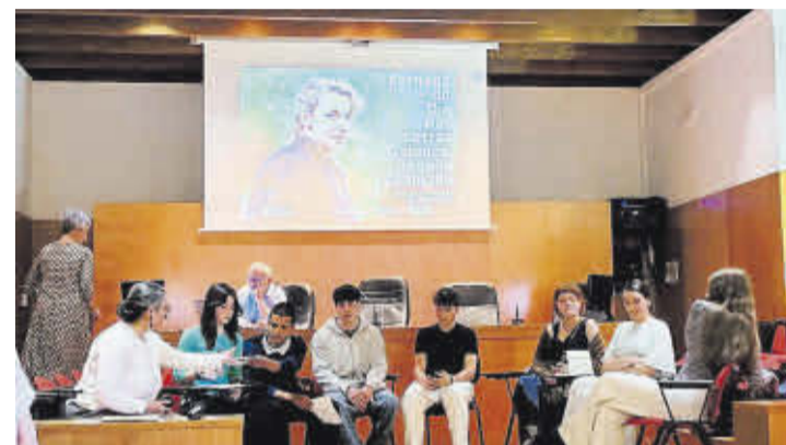
Acto de presentación da obra colectiva do IES Rosalía de Castro.