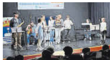
A obra será no auditorio municipal.

O espectáculo presenta a Begoña, unha rapaza decidida que non soporta as mentiras e que atopa no faiado da súa casa un misterioso mapa da verdade. Para seguilo deberá falar con Morgana, Penélope e Circe, superar