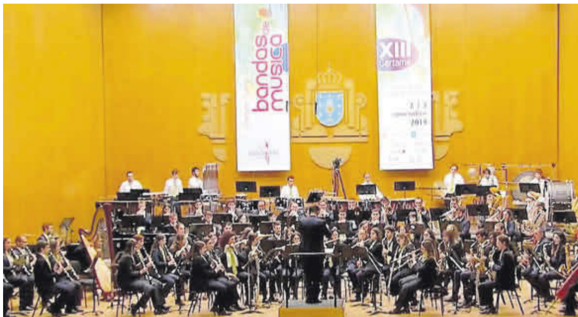
A Banda da Escola de Música de Rianxo durante un concerto.

Esta experiencia non é nova para a escola de música, xa que é tradición que aporten ambiente e alegría á vila barbanzá nunha data especial como a das Letras Galegas.