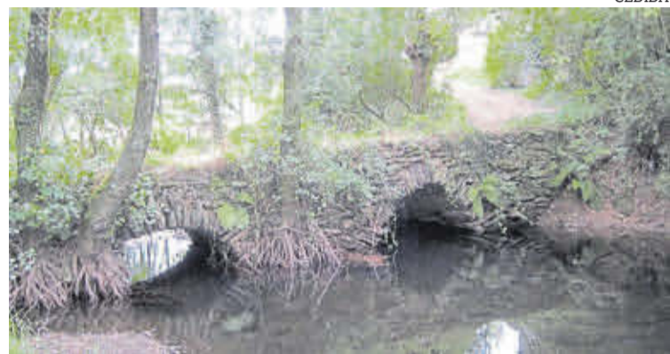
Un dos treitos do Camiño de Santiago entre Arzúa e O Pino.