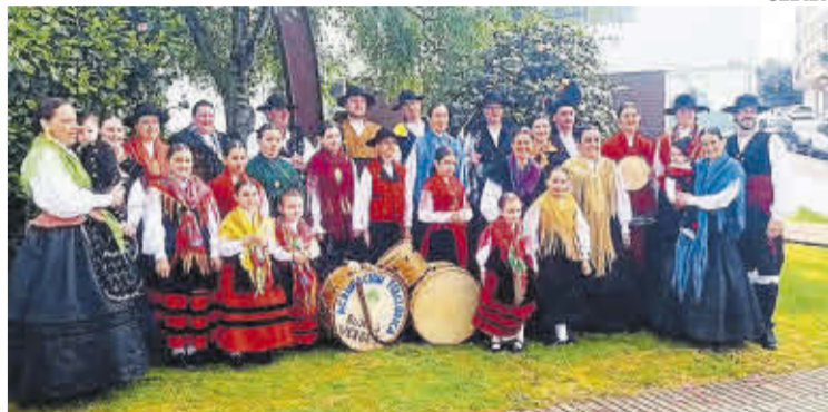
Integrantes da Asociación Folclórica Buxos Verdes.

A festa comezará a partir das 12.00 horas coa apertura de portas e da mostra de artesanía. Ás 13.00 horas, os protagonistas serán a Asociación Folclórica Buxos Verdes e a Asociación Cultural Pontevella cunha xun-