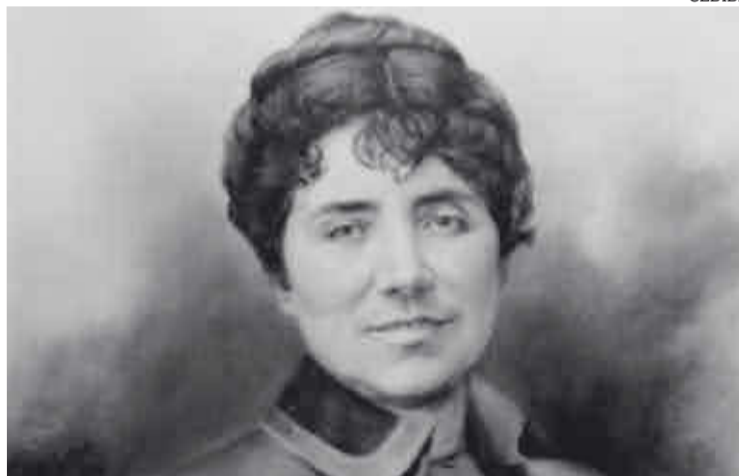
Rosalía de Castro foi a primeira autora homenaxeada polas Letras Galegas.

obra relevante para a cultura do país. A lista de homenaxeados está conformada por destacados nomes como Castelao, Curros Enríquez, Eduardo Pondal, Vicente Risco, Rafael Dieste, María Mariño, Blanco Amor o Uxío Novoneyra.