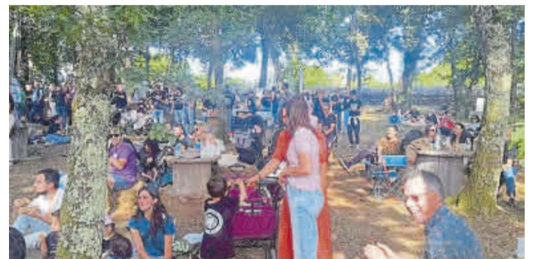
Alguns dos asistentes á celebración nunha edición anterior.

Pechará o evento o concerto da Orquestra Folk de Galicia Son de Seu, ás 19.00 horas. O Concello de Ames e a Deputación da Coruña colaboran na programación. ■