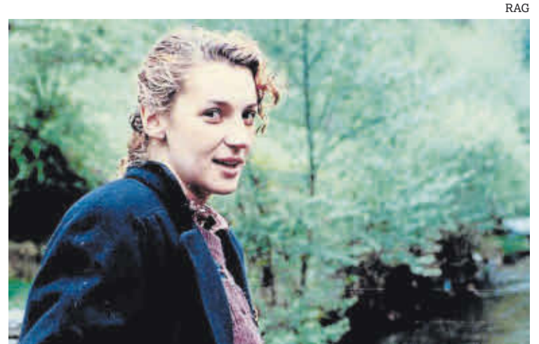
Begoña Caamaño nos anos 80.

Begoña Caamaño faleceu o 27 de outubro de 2014, pouco despois de cumprir 50 anos, a causa dun cancro. A súa carreira literaria e legado social quedaron interrompidos demasiado cedo. Por todo isto a Real Academia Galega dedicalle as Letras Galegas de 2026, recoñecendo a unha escritora que soubo reescribir os mitos, a xornalista rigorosa, a feminista comprometida e a muller que fixo da palabra unha forma de liberdade. ■