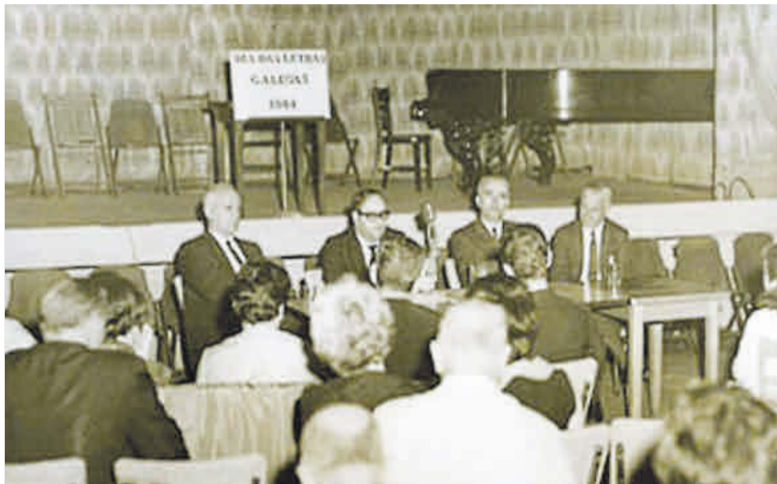
Conferencia na Casa de Galicia de Nova York en conmemoración do Día das Letras Galegas, o 22 de maio de 1964.

que cada 17 de maio se celebraría o Día das Letras Galegas. Deste xeito, Rosalía de Castro foi a primeira persoa homenaxeada, polo carácter fundacional de Cantares Gallegos e polo papel decisivo que tivo na recuperación cultural de Galicia. A partir de aí, cada ano a Academia escolle unha figura diferente, sempre vencellada á creación en galego e cunha