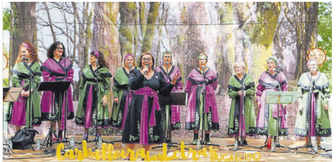
Unha das agrupacións musicais que participaron nunha edición anterior da Carballeira das Letras de Bugallido.

A celebración terá continuidade o domingo, 17 de maio, coa tradicional festa de San Isidro. A xornada arrincará ás 12.30 horas coa misa solemne na honra do patrón, acompañada pola Coral Polifónica de Bugallido. Posteriormente, celebrarase a sesión vermú e a exhibición das escolas de música e baile tradicional.