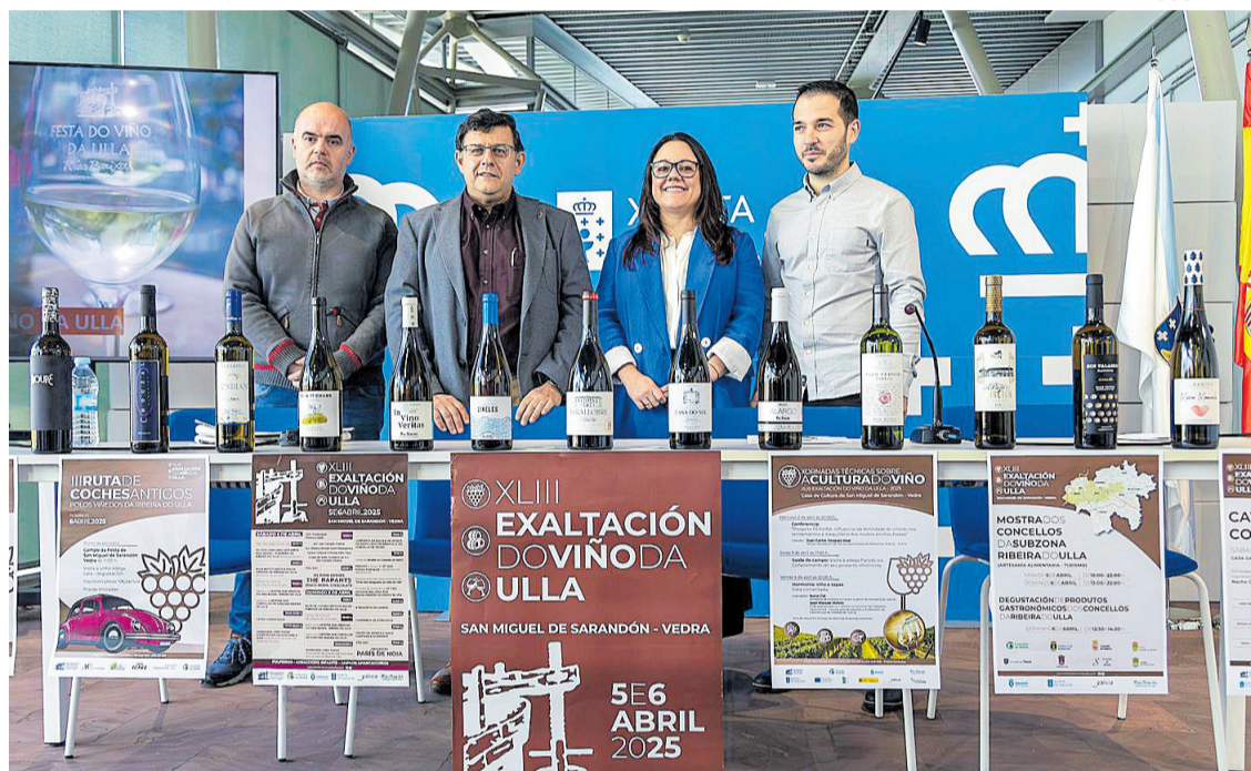
Presentación da 43ª edición da Exaltación do viño da Ulla, que se celebra mañá e pasado en San Miguel de Sarandón.

Trece adegas situadas en oito concellos de A Coruña e Pontevedra amosan os seus viños blancos e tintos