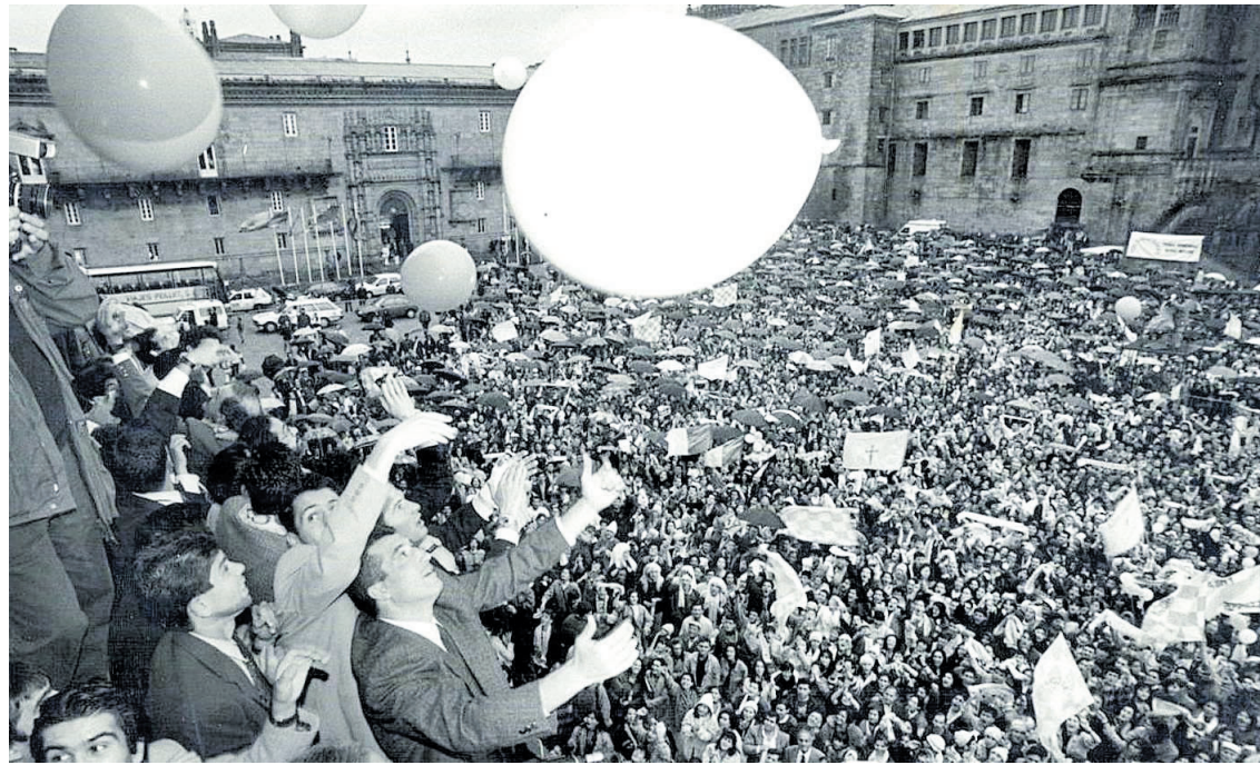
Celebración en la plaza del Obradoiro a la llegada del equipo

Más de 12.000 santiagueses empujaron en Oviedo al Compos a Primera y treinta años después esa vivencia todavía permanece en el recuerdo