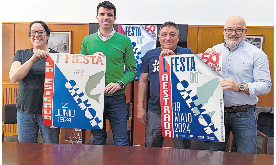
Presentación del cartel de la Fiesta del Salmón de A Estrada

LA MÚSICA CORRE A CARGO DE BIGBAND CARLOS BARRUSO Y LA CORAL POLIFÓNICA ESTRADENSE, ADEMÁS DEL SALMÓN ROCK