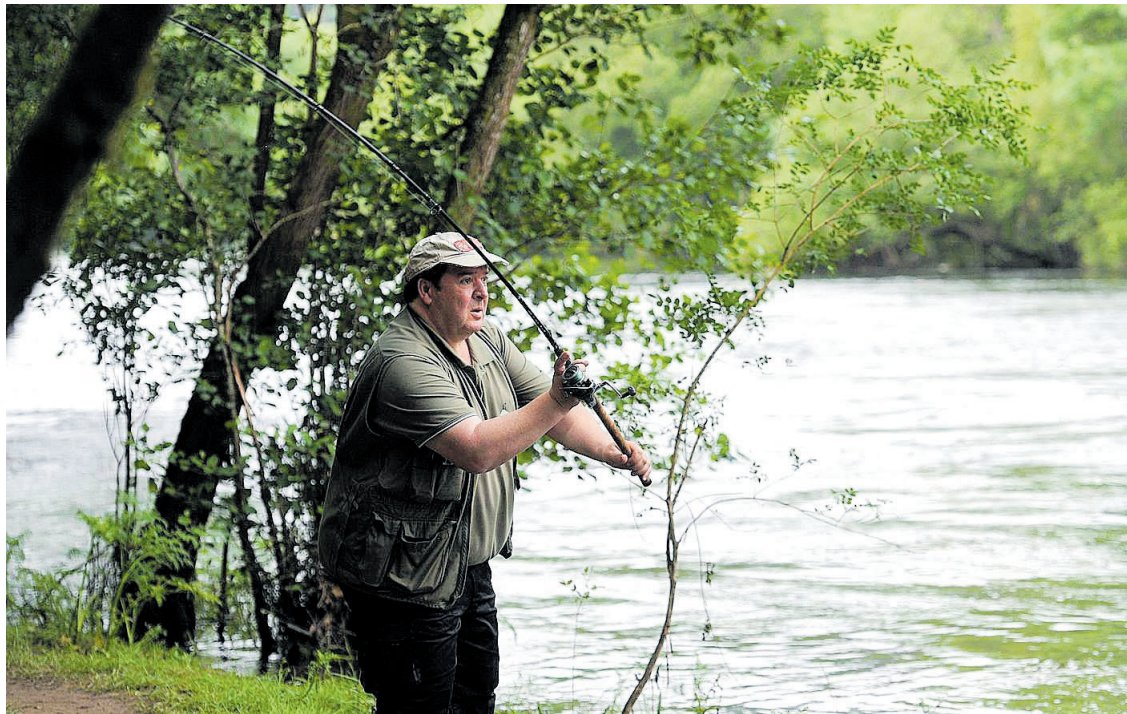
Pesca en el coto de Ximonde