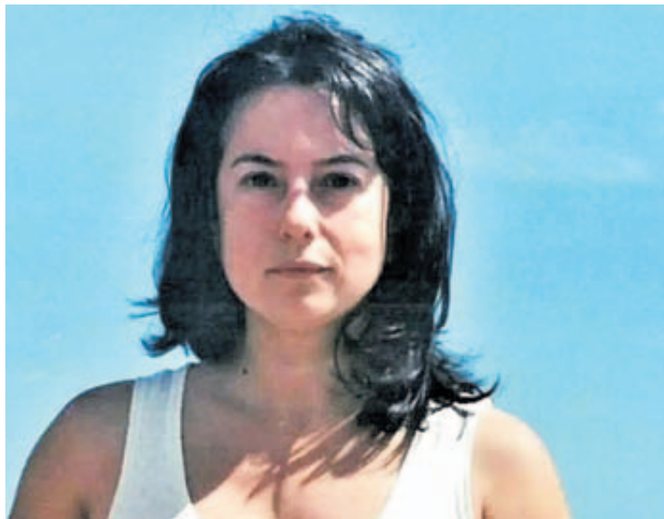
A poeta Luísa Villalta co mar da Coruña ao fondo

Ademais, a RAG ofrece diversos recursos divulgativos sobre Luísa Villalta na súa sección web dedicada ás Letras Galegas 2024. Ana Romaní proporciona unha biografía detallada da autora, así como unha selección de citas da súa obra. Para o público máis novo, lanzouse a web Primavera das Letras, onde se poden atopar actividades interactivas, fichas para colorear e o conto Violino, Inglesa e o libro xigante , unha iniciativa que achega de maneira lúdica a figura da escritora aos máis pequenos.