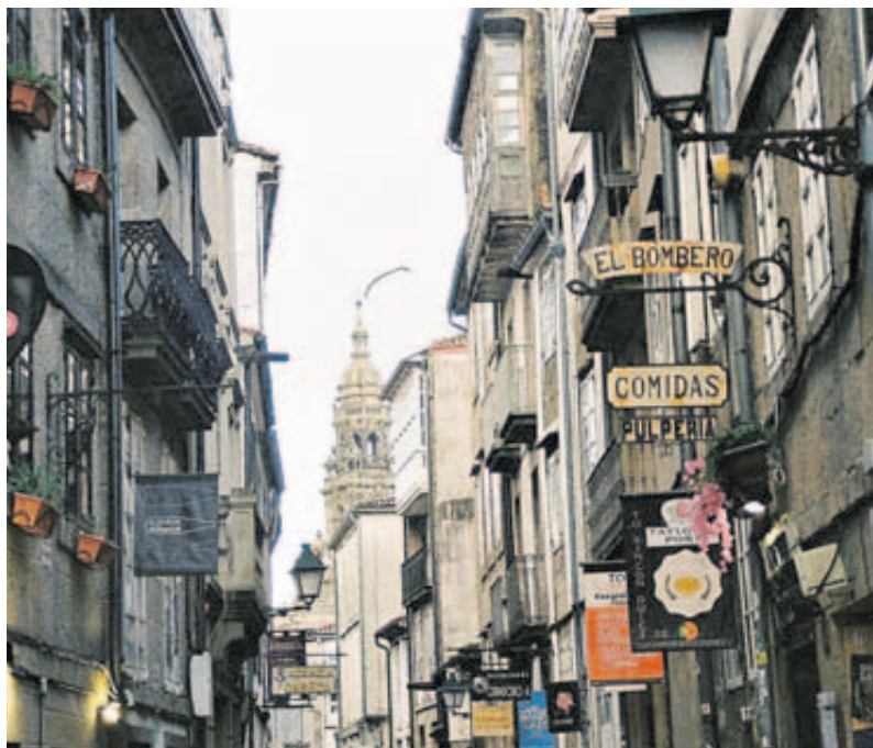
Unha das fotografías participantes na iniciativa de Raxoi polas Letras

de hai días, as estrelas coa mensaxe "Andei por Santiago / pisando estrelas" iluminan as rúas, convidando a cada habitante a reflexionar sobre os seus propios paseos pola cidade e a compartir eses momentos nas redes sociais.