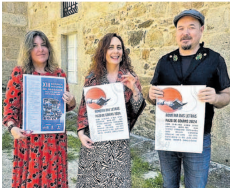
Presentación do programa da Romaría a comezos de maio // C. de Boiro

A xornada principia ás 11:30h coa apertura do recinto e a acollida dos participantes no Barbanza, para logo dar paso a unha variada programación que inclúe a apertura da feira artesanal e literaria, sesións de fotocolor con traxes tradicionais, cortesía da asociación Xilbarbeira, unha exposición dedicada á autora homenaxeada co Día das Letras Galegas 2024, e un taller de ourivería a