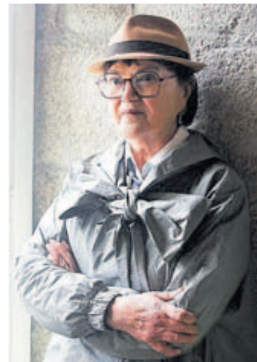
A xornalista, escritora e cineasta Margarita Ledo.

Resulta evidente. É certo que os premios máis notorios que obtivo foron no ámbito da poesía pero, por exemplo, ela o primeiro que escribiu foi teatro, e a súa dramaturxia abofé que está feita para ser, ademais de lida, representada. E tamén hai que destacala no xénero ensaístico... De maneira que, efektivamente, hai outro tipo de rexistros na súa obra, de xéneros literarios, que son máis descoñecidos e están escurecidos pola súa obra poética.