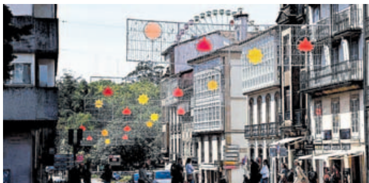
Vista de la Senra con la noria al fondo durante las Fiestas de la Ascensión // Antonio Hernández

Lo mejor de la cocina de Santiago durante sus fiestas