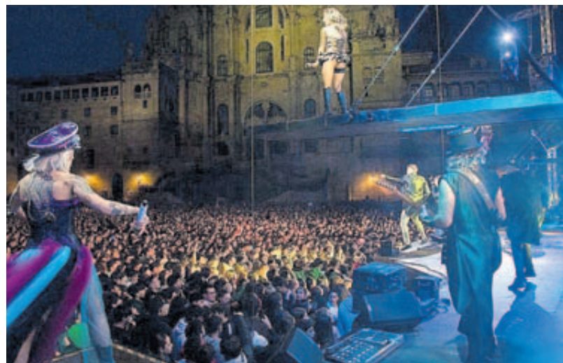
Imaxe da actuación da Orquestra Panorama na Ascensión de 2023 // C.S.

Desde o xoves, as tradicionais alboradas interpretadas por agru-