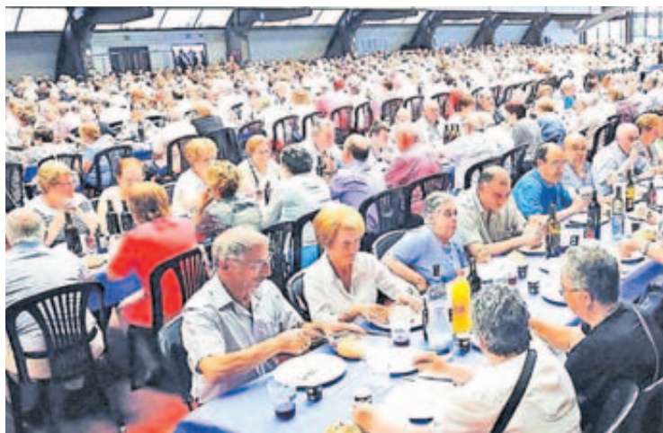
Arriba, Festa dos Maiores, e abaixo, Torneo da Chave, de edicións pasadas

Ademais o programa inclúe outras actividades para públicos diversos, como a representación da peza de teatro Adictos de Penta-