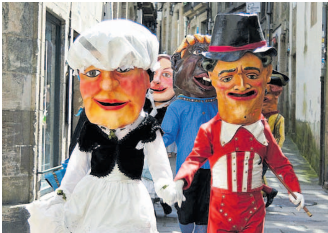
Desfile dos Cabezudos nunha edición pasada // Jesús Prieto

bios no sector gandeiro implicaron unha gran caída das grandes feiras anuais. Ata ese momento, as feiras santiaguesas eran un referente no panorama galego e convocaban a centos de gandeiros e tratantes. O ambiente da feira facíase patente desde días antes, xa que o comercio engalanábase, anunciaba as súas vendas especiais, as funcións relixiosas e as actividades festivas, e, sobre todo, os bailes. Na véspera os animais recorrían a cidade, os feirantes armaban os seus vivos na carballeira e empezaban a traballar os postos de comida. Esa tarde-noite era o punto de