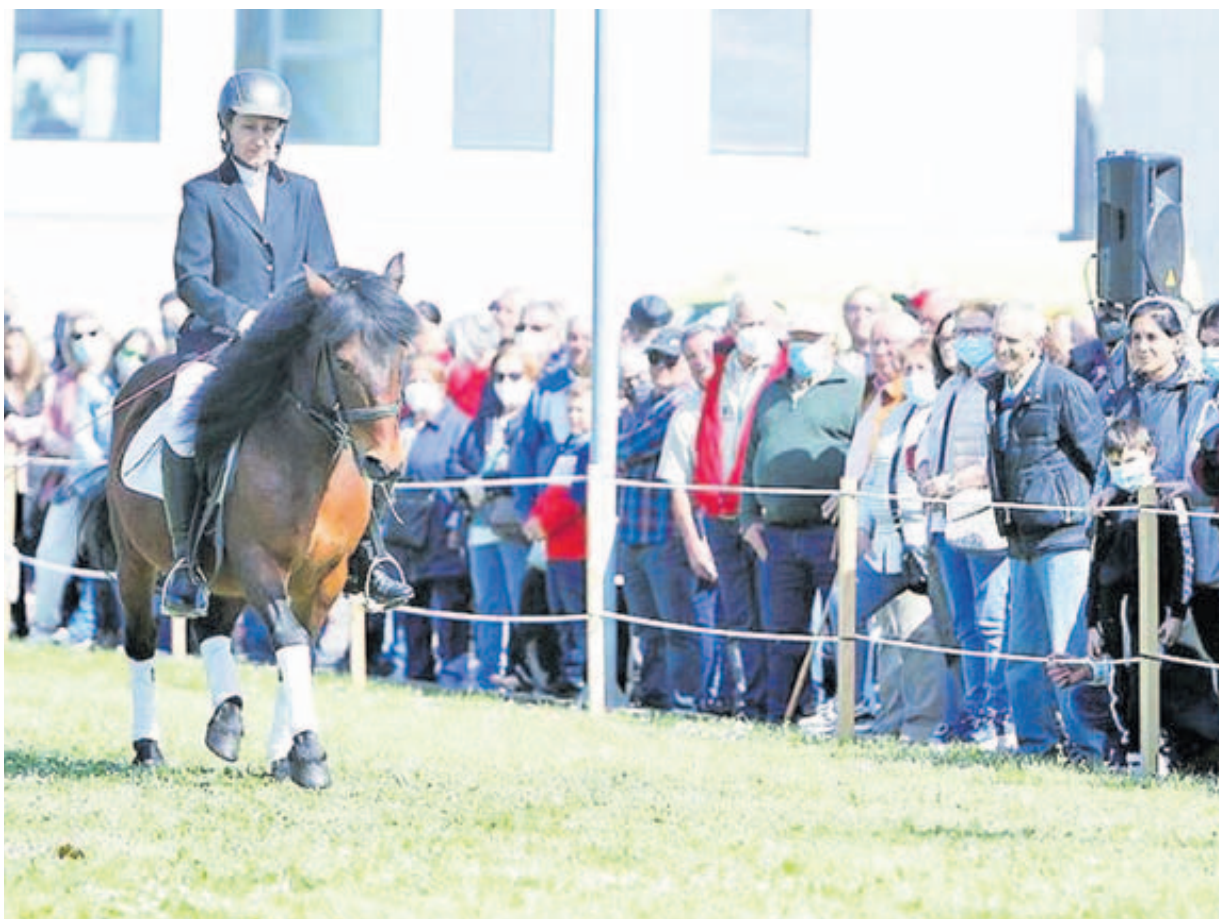
Feira cabalar dunha edición anterior

Os máis pequenos poderán dar breves paseos a cabalo ➤ A outra gran cita é a feira da maquinaria agrícola