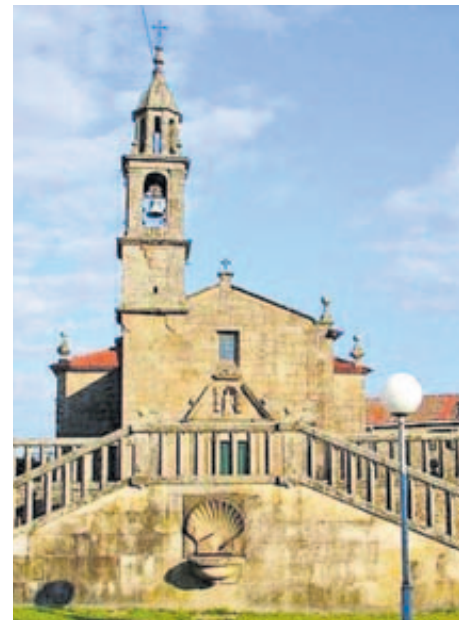
Igrexa en Dodro.

Outro dos atractivos da localidade é o Cruceiro de Avelán ou Bustelo, os seus hórreos, con especial importancia do conxunto de sete hórreos da Lavandeira, en Imo, e mesmo varios reloxos solares.