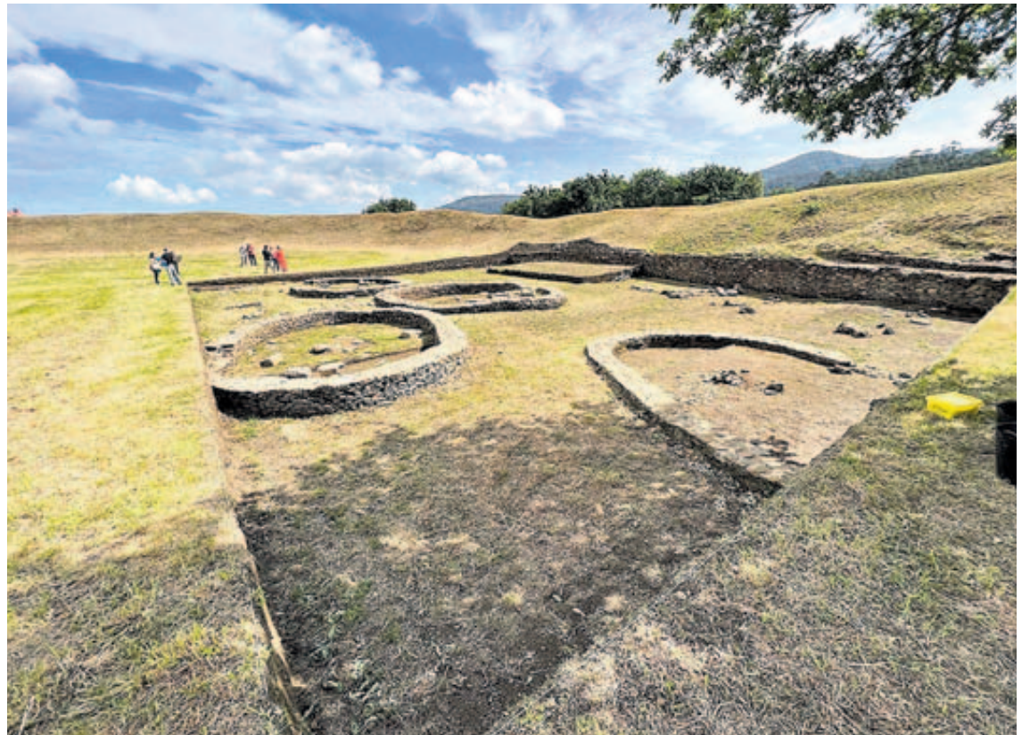
O Castro das Barreiras, considerado polos expertos unha joya xoia do noroeste peninsular

Haberá outras visitas guiadas a varios puntos de interese. Ademais do Castelo de Vimianzo, os Batáns e Muíños do Mosquetín, o Castro das Barreiras e o porto de Cereixo serán outras zonas a explorar. Estas visitas permitirán ás persoas asistentes descubrir a riqueza cultural e arquitectónica de