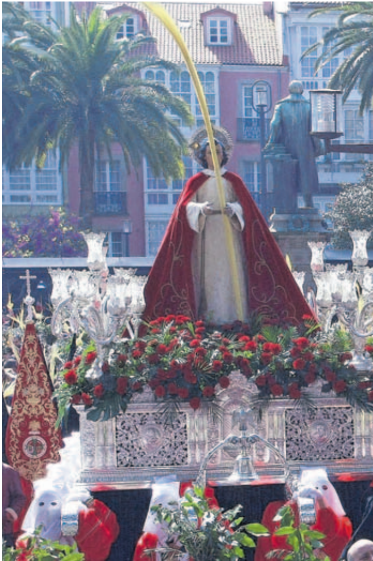
Procesión na Semana Santa de Ferrol 2023