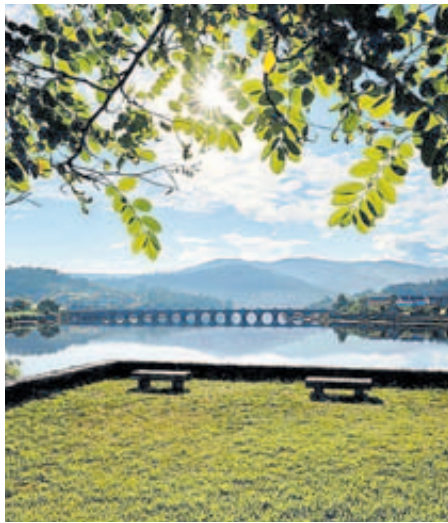
Ponte Nafonso, en Outes.

A gastronomía merece capítulo aparte, con preeminencia na mesa de carnes á pedra ou á brasa; ou os mariscos, como o berberecho, ameixa, ostras, mexilón, navalla