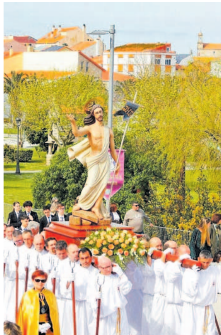
Procesión del Domingo de Resurrección 2023

Finalmente, el Domingo de Resurrección, Porto do Son se une en júbilo para celebrar la victoria de Jesucristo sobre la muerte. La procesión de Jesús Glorioso y el Encuentro de Resurrección son momentos de alegría y regocijo, donde la comunidad cristiana se une para proclamar la Resurrección de Cristo y su triunfo sobre el mal y la oscuridad.