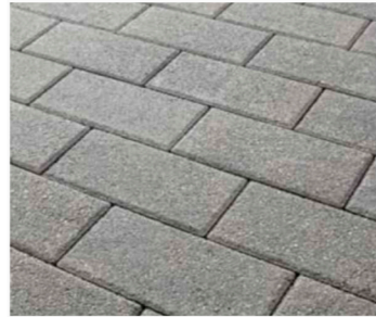
ADOQUIN GRANITO NEGRO