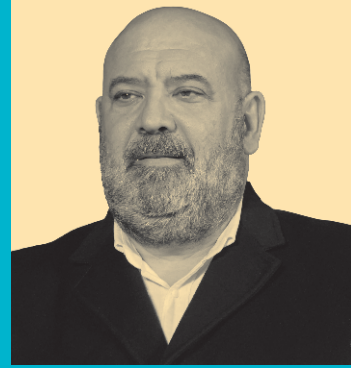
JAIME MARTÍNEZ LLABRÉS Alcalde de Palma

En este primer año como alcalde de Palma me hace especial ilusión felicitar a toda la ciudad con ocasión de nuestras Fiestas de Sant Sebastià. Nuestro patrón protegió Palma de la epidemia de la peste en el siglo XVI y precisamente este año conmemoramos el quinto centenario de la llegada de la reliquia de Sant Sebastià a la Catedral. En su honor celebramos año tras año el orgullo de pertenecer a esta maravillosa ciudad.