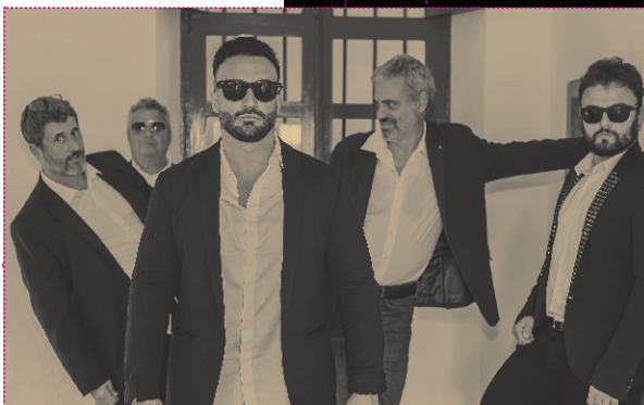
Tardes en el Cafè

EN LA PL. MAJOR a las 20 h Tardeo Verbena Sant Sebastià balla con Tardes en el Cafè y Valnou