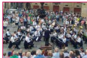
Banda de Musica Municipal de Brion