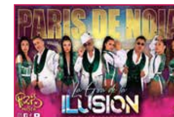
Orquestra París de Noia