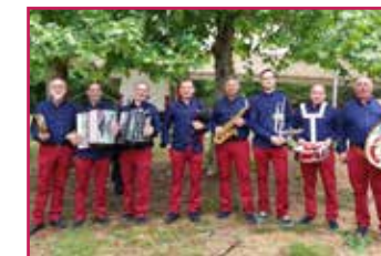
Tiralle do Aire