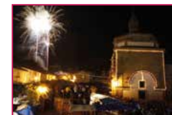
Fogos de Artificio