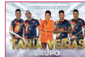
Grupo Tania Veiras