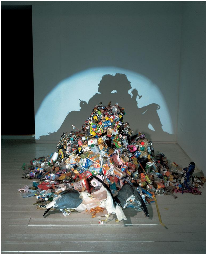
Tim Noble & Sue Webster. Dirty white trash (with gulls) , 1998