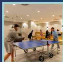
SALAS DE JUEGOS