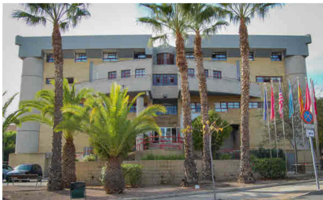
Oficinas del COIE en el Edificio Rector Soler.

Se están desarrollando actividades de turismo empresarial, donde el estudiantado universitario podrá conocer de primera mano empresas de la Región de Murcia