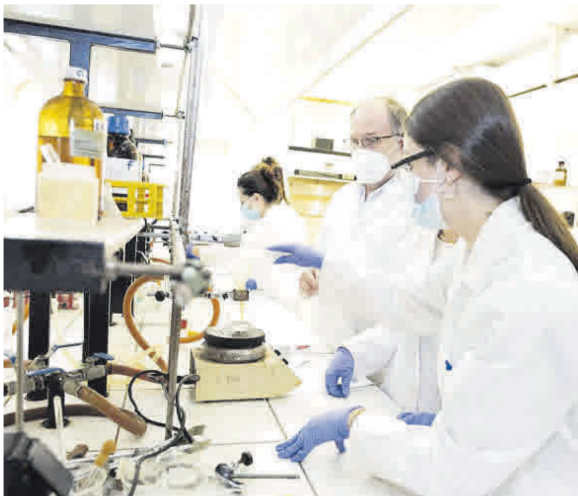
El COIE ha incorporado nuevos enfoques y herramientas desde su creación en 1982.

El COIE ha evolucionado desde su creación hasta la actualidad, incorporando nuevas líneas de actuación, nuevos enfoques y nuevas herramientas, en respuesta a las necesidades emergentes de universitarios y empresas. Además de las actividades habituales y permanentes, podemos destacar como nuevos proyectos del COIE la actualización de su Guía de Salidas Profesionales de los Grados de la UMU, una web cuyos contenidos han sido elaborados por el propio Centro de Orientación e Información de Empleo (COIE) y están dirigidos a estudiantes universitarios y preuniversitarios, así como a los profesionales de la orientación, la