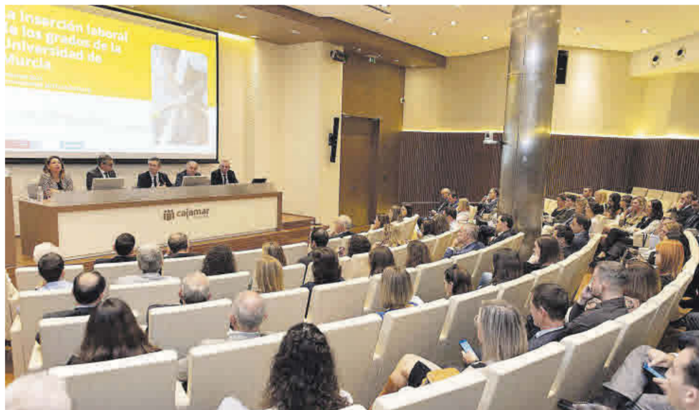
Presentación del informe de inserción laboral de la Universidad de Murcia.

«La evolución ha sido ligeramente ascendente, si bien, en la última edición los resultados no mejoran, aunque sí lo hace la calidad del empleo. Pero esto podría explicarse, entre otros motivos, por el efecto de la pandemia sanitaria, ya