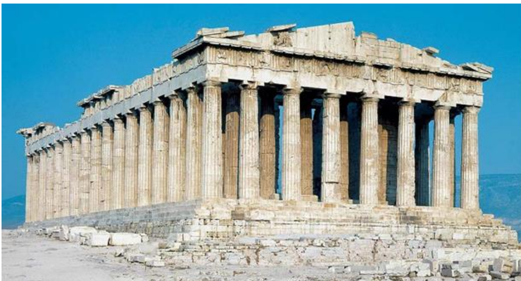
Imagen 3: El Partenón. Atenas, 447-438 a.C.