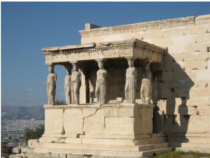
Imagen 2: Tribuna de las Cariátidas de El Erecteion. Atenas, 421-406 a.C.