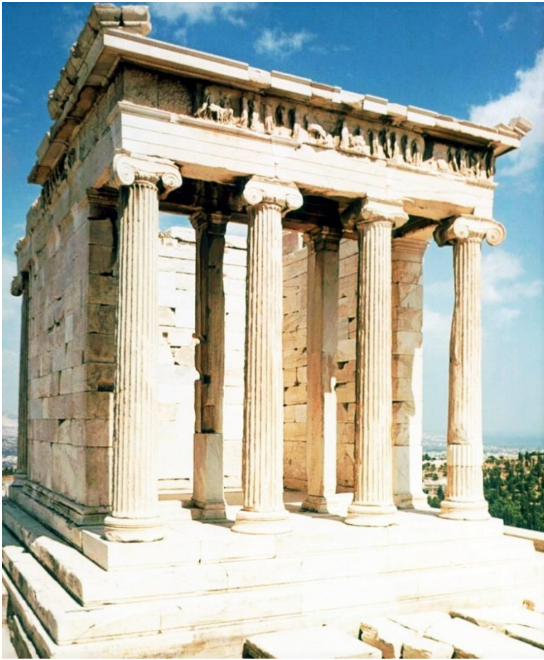
Imagen 1: Templo de Atenea Niké. Atenas, 427-424 a.C.