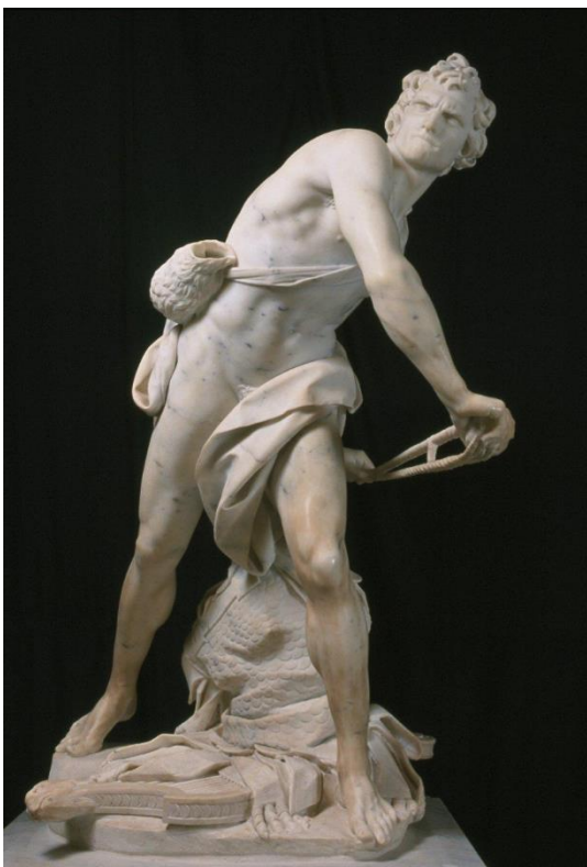
Imagen 5: Gianlorenzo Bernini. 1623-1624. David. Mármol, 1,70 m. Galleria Borghese, Roma.