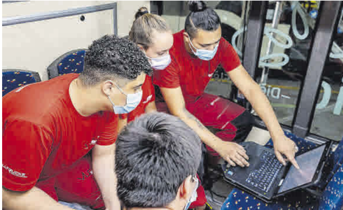
El apoyo a la FP se centra en los sectores productivos identificados como estratégicos.

A propuesta del Ministerio de Educación y Formación Profesional, los cuatro reales decretos renuevan el Catálogo Nacional de Cualificaciones Profesionales (CNCP). Con esta aprobación, se crean 49 nuevas cualificaciones pro-