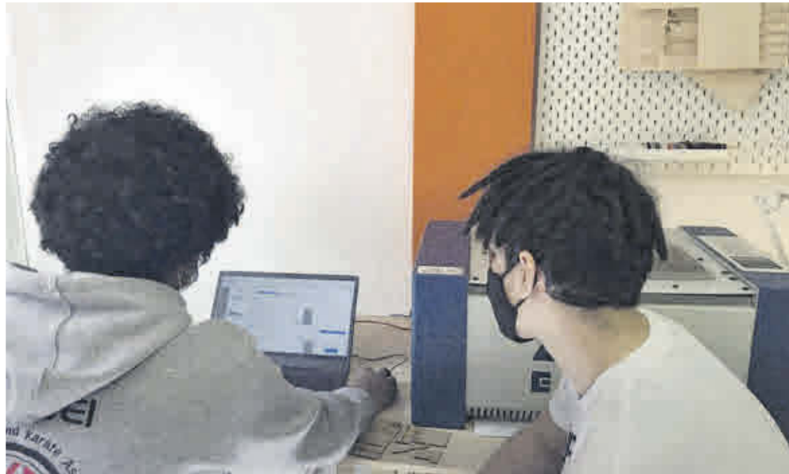
La nueva norma regulará la relación entre las enseñanzas de Formación Profesional y las universitarias.

Esta nueva estructura facilita, según el Ministerio, el acceso a un abanico de formaciones de distinta duración y volumen de aprendizajes