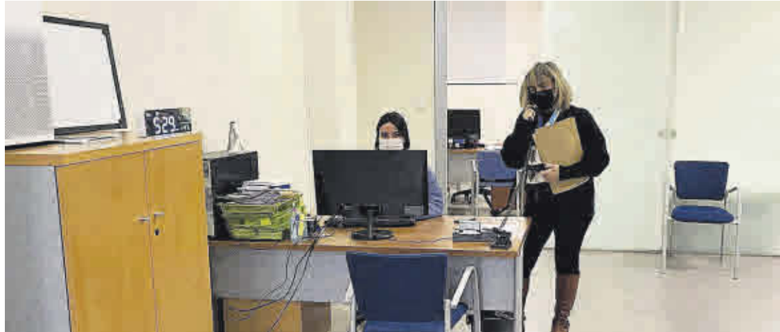
Consureste ha retomado el ritmo de formación, impartiendo cursos todos los días, incluso los sábados.

Tras el impacto de la crisis sanitaria, Consureste dio el paso de ofrecer su oferta formativa por medio online, algo que a día de hoy sigue manteniendo, aunque sin dejar de lado aquellos de carácter presencial. Sus cursos van