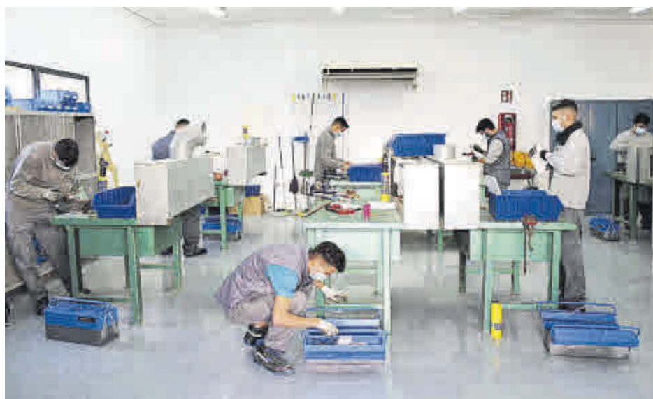
El Certificado de Profesionalidad de 'Montaje y mantenimiento de instalaciones de climatización y ventilación-extracción' (Nivel 2) dará comienzo en marzo.