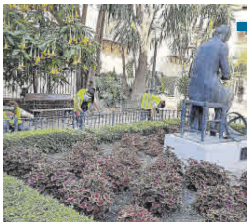
Prácticas de pintura en la Plaza de Concepción Sandoval.

Las nuevas tecnologías, igualmente, han configurado una gran parte de las acciones formativas ejecutadas hasta el momento. Digitalización y restauración digital de imágenes, y operaciones auxiliares de montaje y mantenimiento de sistemas microinformáticos son solo dos de las muchas acciones incluidas en esta materia entre las que también destaca la confección y publicación de páginas web.