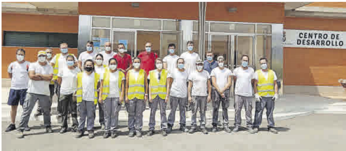
El Ayuntamiento de Águilas trabaja para mejorar la cualificación profesional de los desempleados del municipio.

El segundo es 'Atención sociosanitaria a personas dependientes en Instituciones Sociales' (370 horas). Se enseñará al alumnado a cuidar a personas dependientes en instituciones como residencias de ancianos, etc.