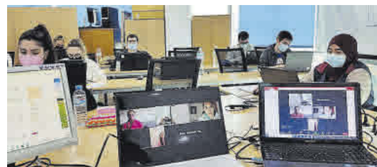
Alumnos atendiendo clase en aula mixta.

agroalimentarios', orientado a formar operarios de fábrica y cargos intermedios para el sector, y dirigido a personas desempleadas mayores de 45 años y paradas de larga duración. «Somos prácticos, te formamos para mejorar tu empleabilidad y tu salario».