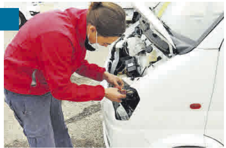
Un joven trabaja en el montaje de un faro de un vehículo.

Un equipo de profesionales integrados por dos coordinadoras que realizan labores de apoyo a la formación y a la inserción laboral; y un técnico de gestión del Programa Gefe y docente de los módulos de informática de las acciones