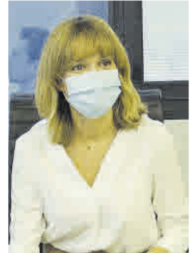
La ministra de FP, Pilar Alegría.

Esta nueva estructura facilita, según el Ministerio, el acceso a un abanico de formaciones de distinta duración y volumen de aprendizajes que incluye, por primera vez, unidades formativas o 'microformaciones' (Grado A), hasta alcanzar los títulos y cursos de especialización (Grados D y E). El Grado B es referido a un módulo profesional y el Grado C reúne varios módulos y conduce a la obtención de un Certificado Profesional.