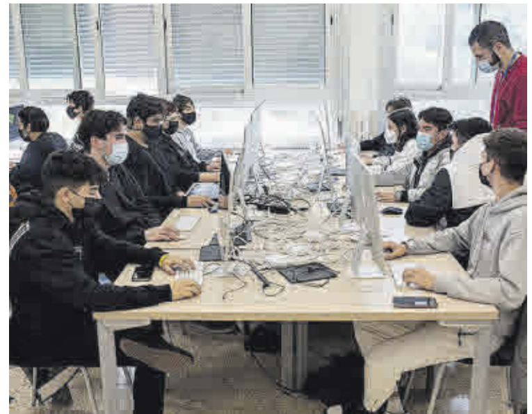
Alumnos de Animación 3D en Realidad Virtual y Realidad Aumentada, en el Institut Tecnològic de Barcelona.