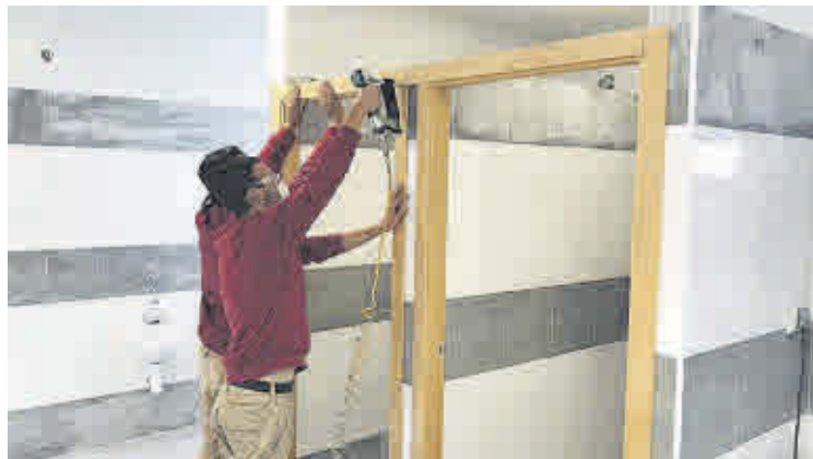
Estos cursos cuentan con un módulo de prácticas profesionales no laborales.

El Centro de Formación del Ayuntamiento de Molina, dependiente de la citada Concejalía, es el encargado de llevar a cabo la gestión y administración de las acciones formativas, así como la coordinación, seguimiento y la justificación económica de las mismas.