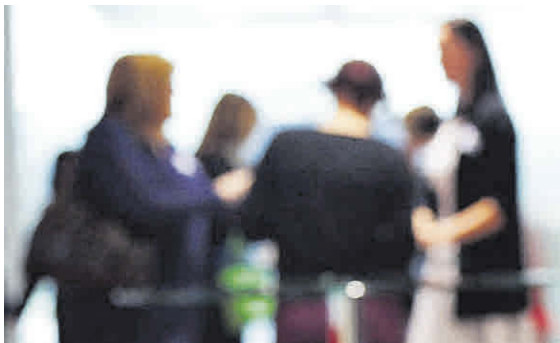
Va destinado también a víctimas de trata y otras formas de explotación sexual.

El SEF destinará 760.000 euros a un programa de formación con compromiso de contratación dirigido a este colectivo de mujeres, para promover la igualdad y potenciar el empleo femenino