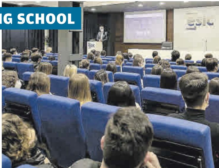
Para esta escuela, la innovación en educación es condición esencial.

► La innovación en la educación es una condición esencial en ESIC. Por lo tanto, este año organizará, por octavo año consecutivo, el congreso internacional IMAT, que pone el foco en las últimas tendencias en educación y herramientas, las cuales son facilitadoras de los procesos de adaptación al cambio ante los retos que plantea el nuevo escenario educativo, económico, social, político y tecnológico.