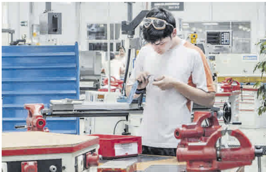
El sector empresarial apoya la adaptación de la formación a sus distintas necesidades.

Es precisamente el carácter activo de este tipo de formación, que lleva a la aplicación práctica en empresas de lo aprendido en los centros de enseñanza, lo que las propias empresas llevan demandando mucho tiempo. Esta