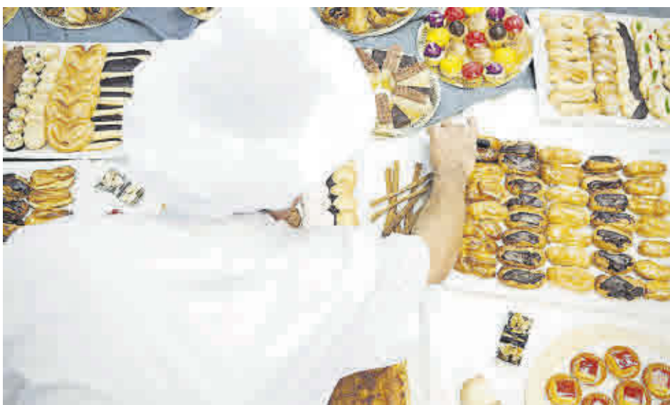
El Ayuntamiento de Murcia es la única entidad en la Región que realizará el curso 'Pastelería y confitería' en 2022.