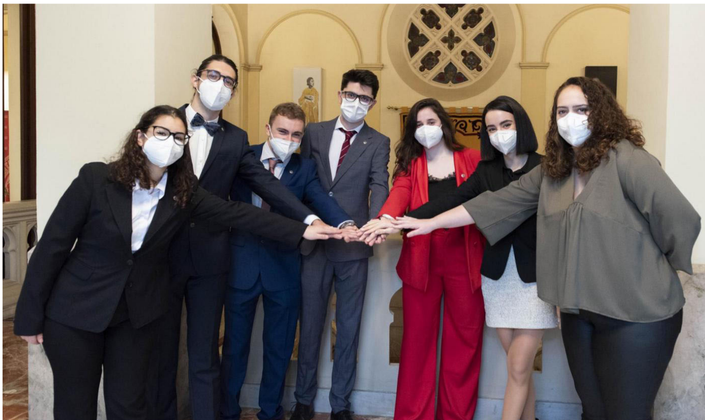
Nueva junta directiva del Consejo de Estudiantes.