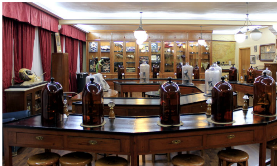
Museo José Loustau.