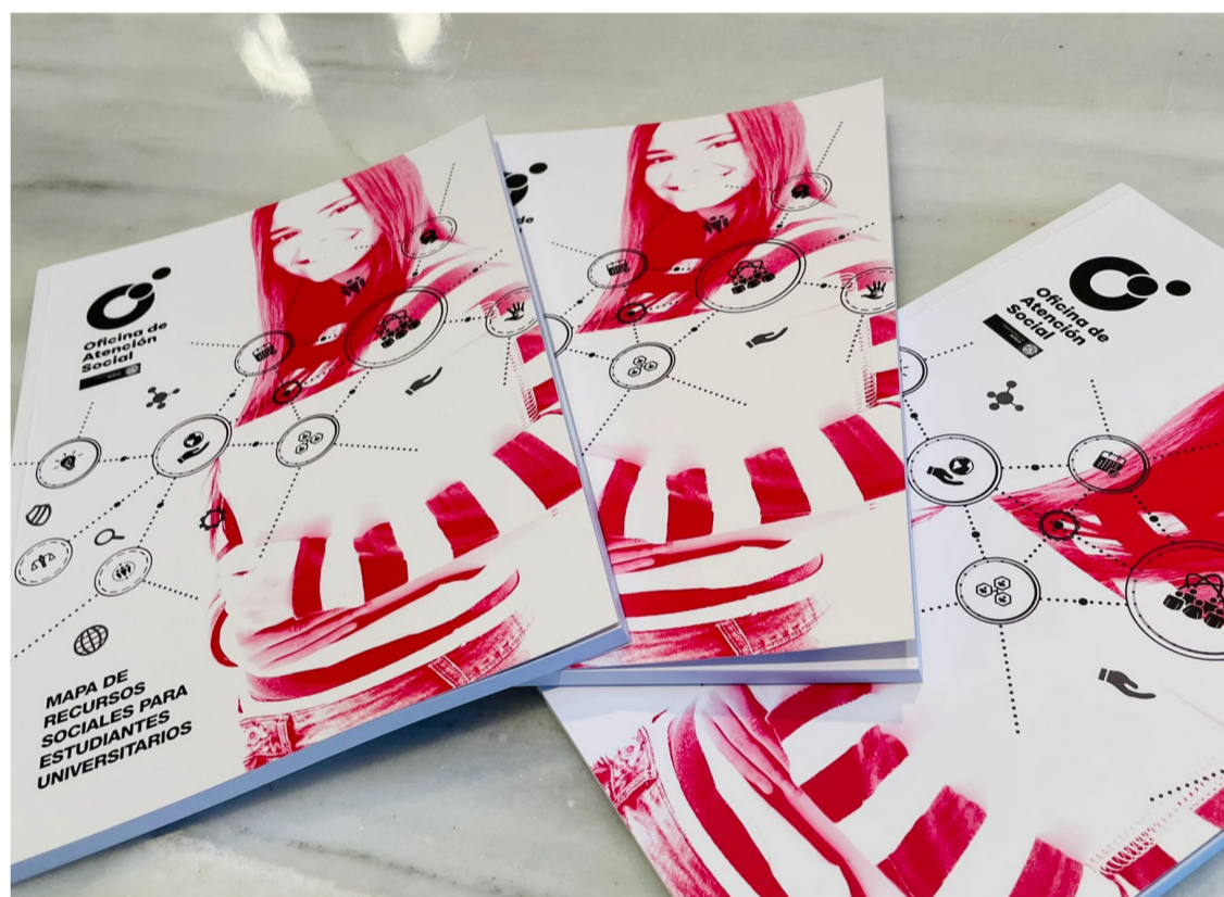
Mapa de Recursos Sociales para Estudiantes de la UMU.

Para acceder a estas ayudas, basta con ser estudiante de la Universidad de Murcia, no ser beneficiario de becas para el estudio o cualquier ayuda de análoga naturaleza, carecer de rentas o patrimonio con el cual poder dar respuesta a su situación de urgente necesidad, y acreditar docu-