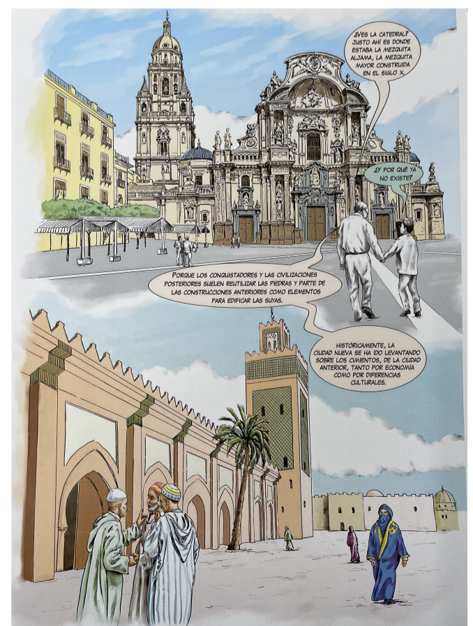
Murcia, S.VIII-S. XIII. De Teodomiro a Alfonso X.