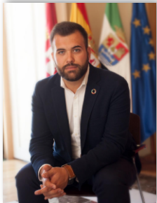
Luis Salaya Julián ALCALDE DEL EXCMO. AYTO DE CÁCERES

La Navidad está hecha de reencuentros y de celebraciones, despedamos pues este 2021 disfrutando juntos, con mucha prudencia pero, este año sí, juntos. Desde el Ayuntamiento os deseamos unas felices fiestas y un 2022 cargado de buenos momentos.