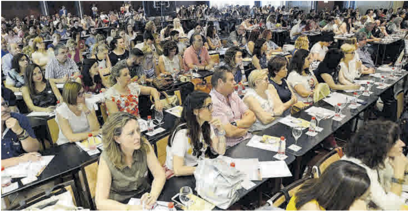
Foto de archivo de una Asamblea General celebrada por Ucoerm.