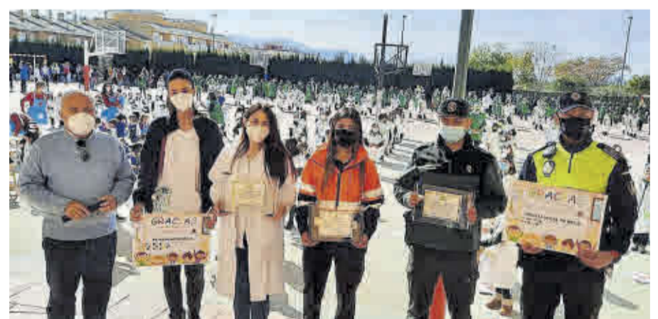
Acto de homenaje a representantes de los sanitarios, Policía Local, Guardia Civil y Protección Civil, celebrado en el Colegio Santa Clara, el pasado 16 de febrero en las instalaciones del centro.